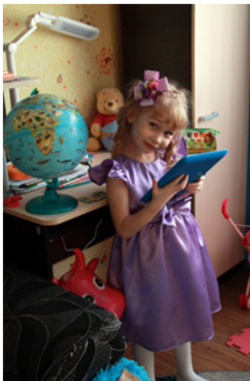
Фото работа «Праздник к нам приходит!»

КРОО ПСП «Дошкольник» г. Красноярск, ул. Академгородок 30-21, e-mail: doshkolnik@list.ru